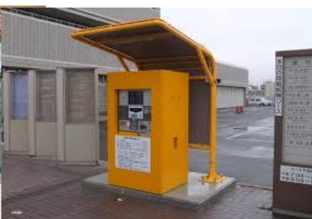
コインパーキング