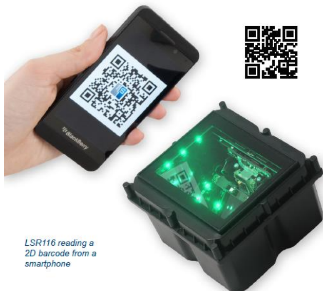
LSR116 reading a 2D barcode from a smartphone